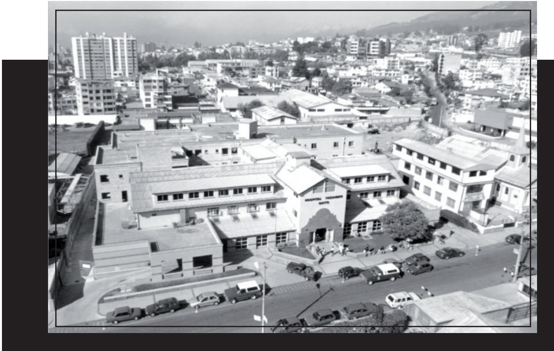
En 1996 se terminó el denominado "Proyecto vida" de ampliación del Hospital Vozandes.