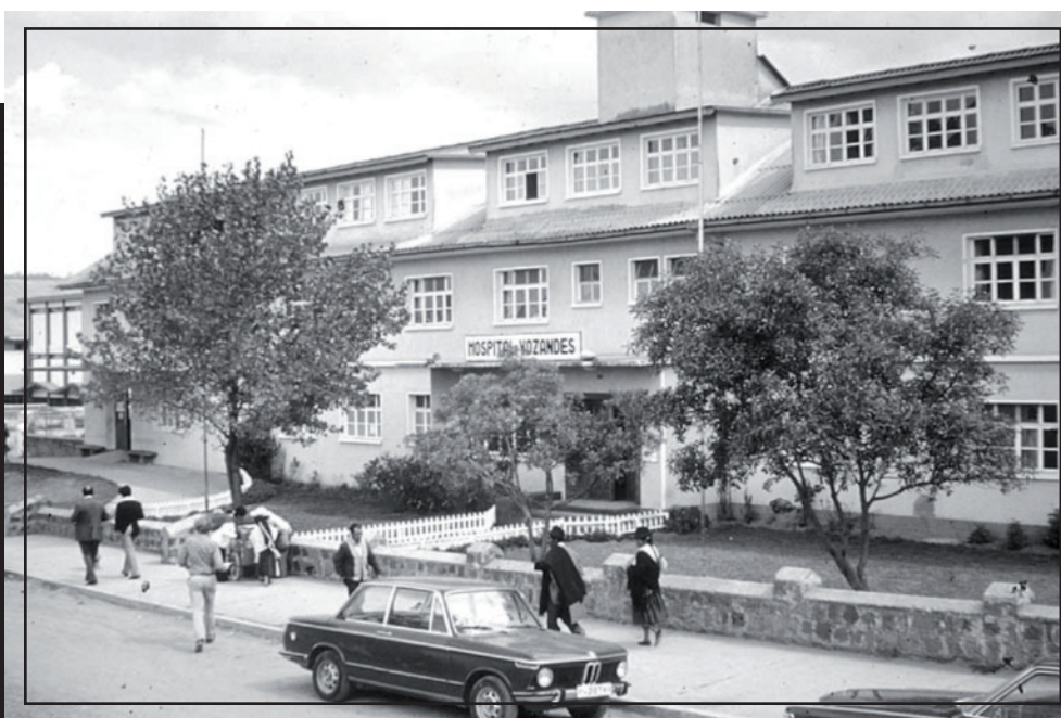
Vista frontal del Hospital Vozandes Quito en los años 70. Luego en 1986 comenzaría el proyecto de expansión del hospital para satisfacer la demanda.