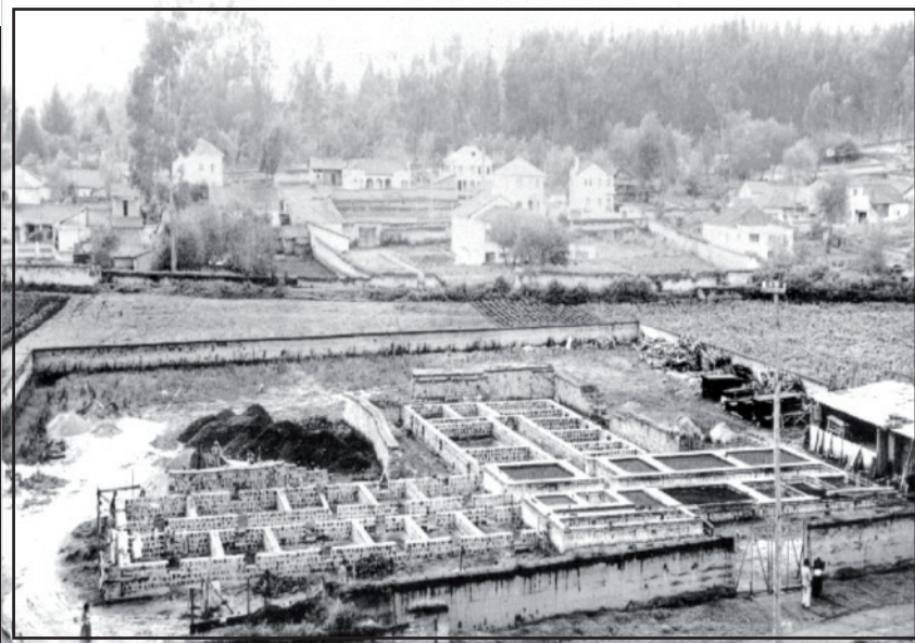
En 1953 se recaudaron fondos para adquirir el terreno. La fotografía muestra los cimientos del Hospital Vozandes en 1954.