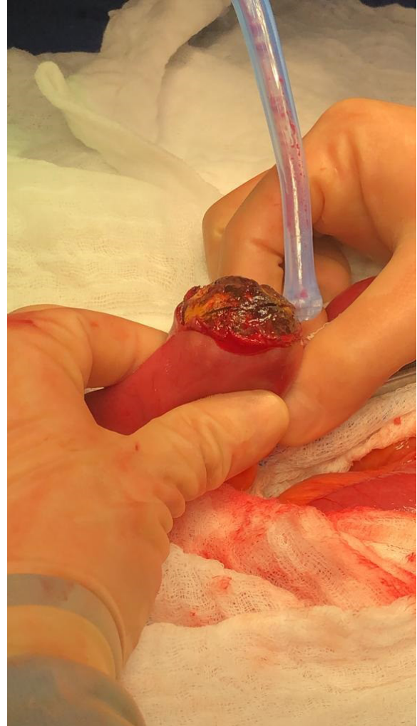
Figura 3. Asa yeyunal con presencia de masa que causa obstrucción intestinal completa. Nótese el cambio de coloración de la misma y la presencia de un gran lito intraluminal al realizar la enterotomía.

La TAC con medio de contraste es el método de elección para el diagnóstico, con sensibilidad \geq 90\% . El tratamiento está encaminado a resolver la obstrucción intestinal, previa estabilización del paciente, y la cirugía continúa siendo el manejo de elección en estos pacientes.