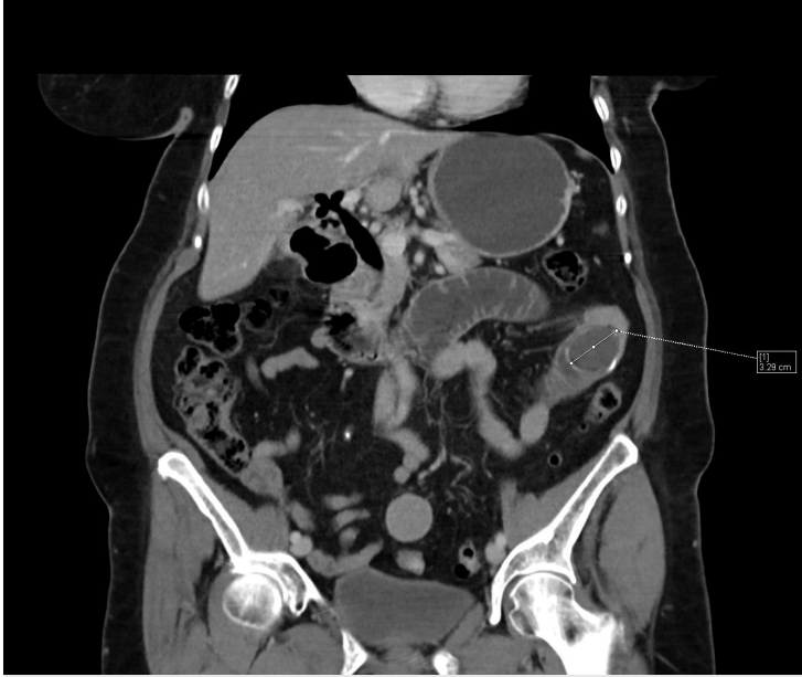
Figura 2. Tomografía Computarizada de abdomen y pelvis. Se observa una imagen hipodensa en región lateral izquierda que ocupa por completo la luz de un asa intestinal.

En 1941 Rigler, Borman y Noble describieron los signos clásicos, conocidos como "Triada de Rigler" (40-50%): cálculos ectópicos, neumobilia (signo de Gotta-Mentschler), y distensión de asas intestinales (2) . Dos de tres establece el diagnóstico. La fístula puede ser colecisto-duodenal (65%-75%), principalmente íleon terminal (70%); colecisto-colónica (10%-25%); o colecisto-gástrica (5%); y formarse por colecistitis recurrente (0.3-0.5%) o secundaria al síndrome de Mirizzi.