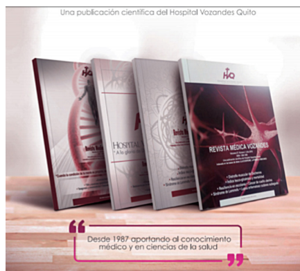
Gráfico 2. Diferentes portadas de la Revista Vozandes.

La inclusión a bases de datos internacionales es un ejercicio de responsabilidad con los lectores y con los autores, que esperan que sus trabajos sean reconocidos en los más amplios ámbitos nacionales e internacionales de difusión, lograrlo no ha sido fruto de la casualidad, sino del buen hacer editorial, de su competencia y rigor.